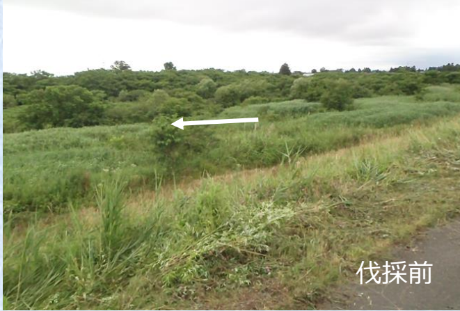
江合川左岸 下谷地地区