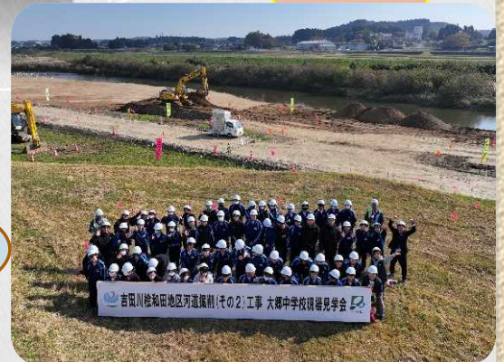
ドローンを使用した集合写真

工事作業等につきましては、事故など無いように十分安全に注意し進めておりますが、何かありましたら出張所までご連絡をお願いします。