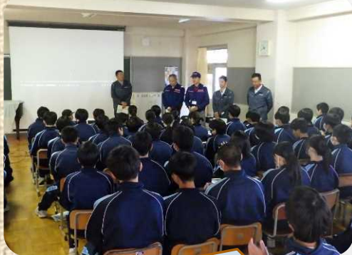
出張所職員による事業説明

さて、11月13日、爽やかな秋晴れの空の下、大郷中学校2年生、70人を対象に只野組主催の現場見学会を実施しました。第一部では、北上川下流河川事務所のPR動画視聴、出張所長より事業について説明しました。第二部では、吉田川桧和田地区河道掘削その2工事の現場へ移動し、工事の規模と掘削の様子を見学し、実際にICT建設機械の乗車体験をしてもらいました。普段なかなか経験することができない貴重な見学会になったことと思います。生徒の皆さん、河川管理の多方面にわたる色々なお仕事について知識を深め、身近な川について学んだ思い出として心に残ったのではないのでしょうか。