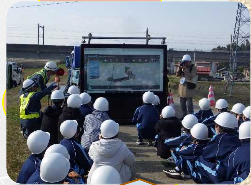
只野組による現場説明