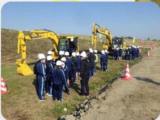
ICT建設機械の乗車体験