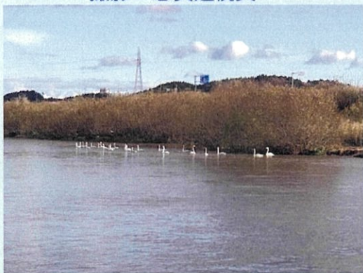
吉田川右岸 27.5キロ付近にて