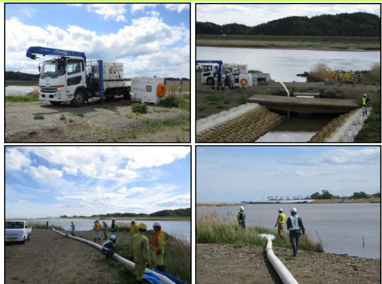
ポンプパッケージ訓練の実施状況

排水ポンプパッケージは、排水活動に必要な機材（排水ポンプ、排水ホース等）や操作盤をコンパクトにパッケージングしたもので、2tトラックに発電機と共に積載することで簡易型の排水ポンプ車として排水活動が行えるものです。