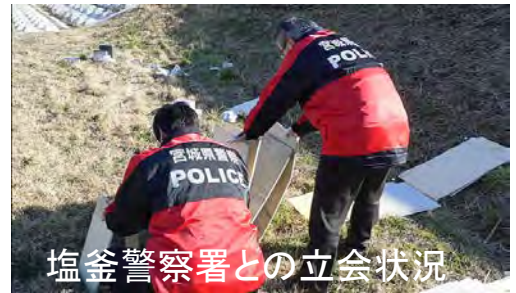
塩釜警察署との立会状況

不法投棄は絶対に許されない行為です。この行為に対して、警察と連携し、原因者を調べます。