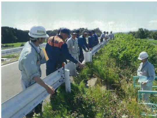
松島町との点検状況

この本格的な大雨の時期を前に、洪水時に危険になると思われる箇所について、各市町や水防団と合同で点検を行いました。