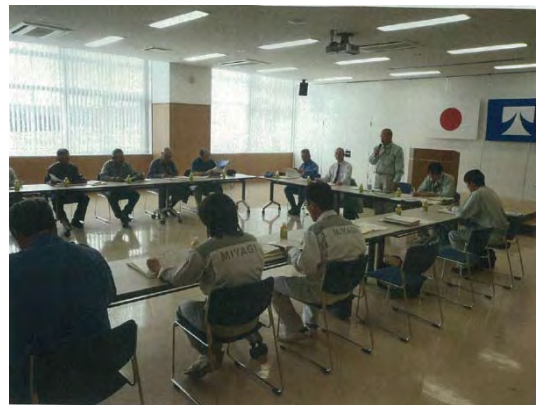
大和町との意見交換会実施状況