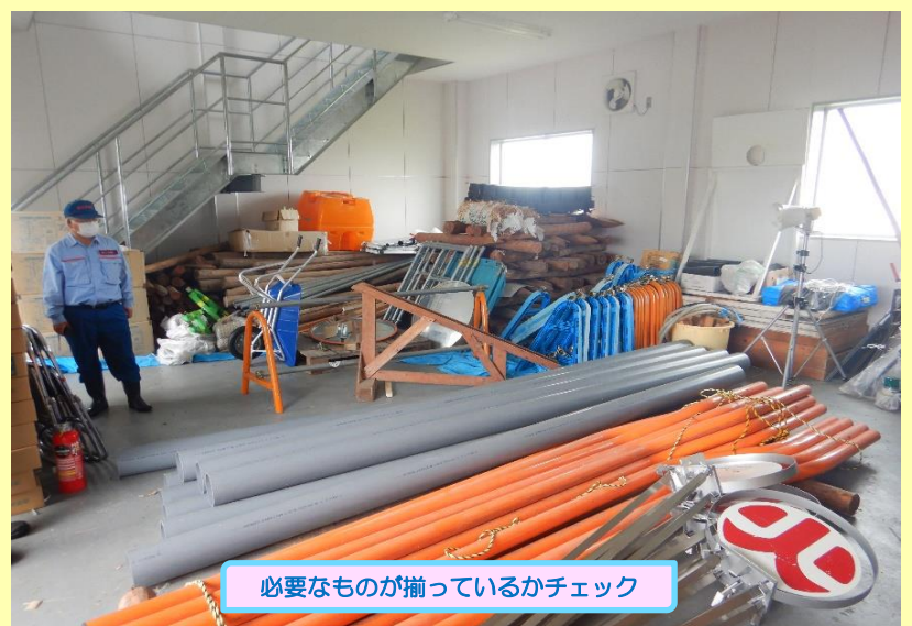
必要なものが揃っているかチェック