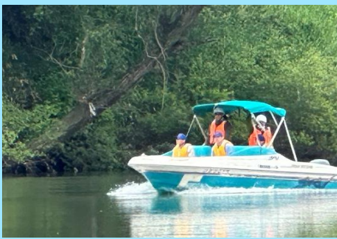
陸上から見えない所までチェック