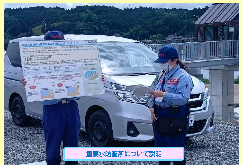
重要水防箇所について説明