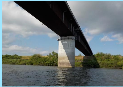
見ることができない新米谷大橋の裏