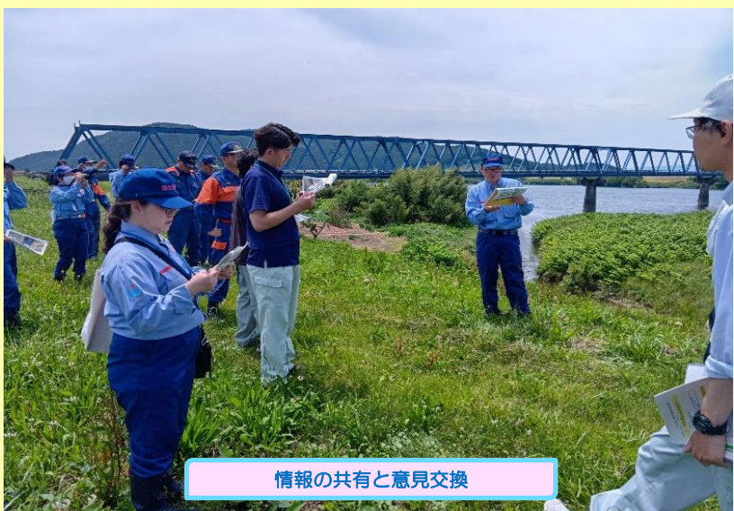
情報の共有と意見交換