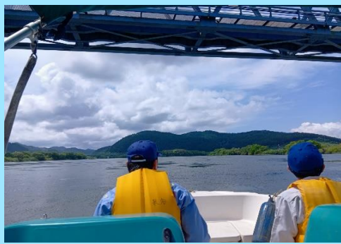
法崩れなどないか目視で確認