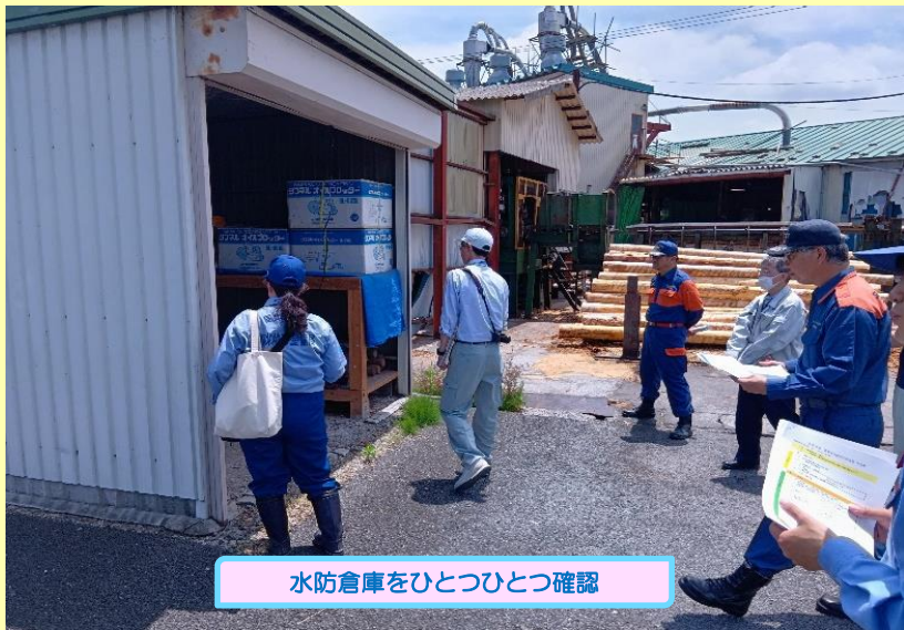
水防倉庫をひとつひとつ確認

米谷出張所では、梅雨本番に備えて管理している各地区（登米市津山、登米、中田、東和地区）の重要水防箇所（※）の確認や、水防資材の確認を宮城県・登米市・水防団などの関係機関と合同で6月10日（火）・24日（火）に行いました。また、巡視の後は洪水時に迅速かつ適切な対応を行えるよう、水防活動に必要な情報の共有と減災に向けての意見交換会を行いました。