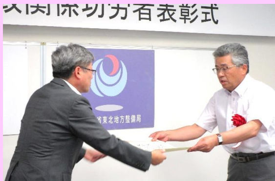
(株)いのまた様 工事名：北上川下流米谷管内維持工事

令和5年度完成工事で、工事成績が優秀で卓越した技術力や創意工夫があったもの、困難な条件を克服したものに贈られます。