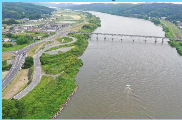
新しい県道・旧道・北上川コラボ