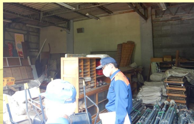
【水防倉庫】の水防資材を確認しました。