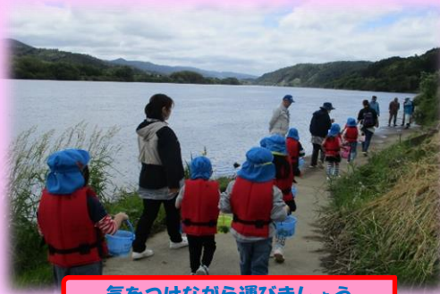
気をつけながら運びましょう