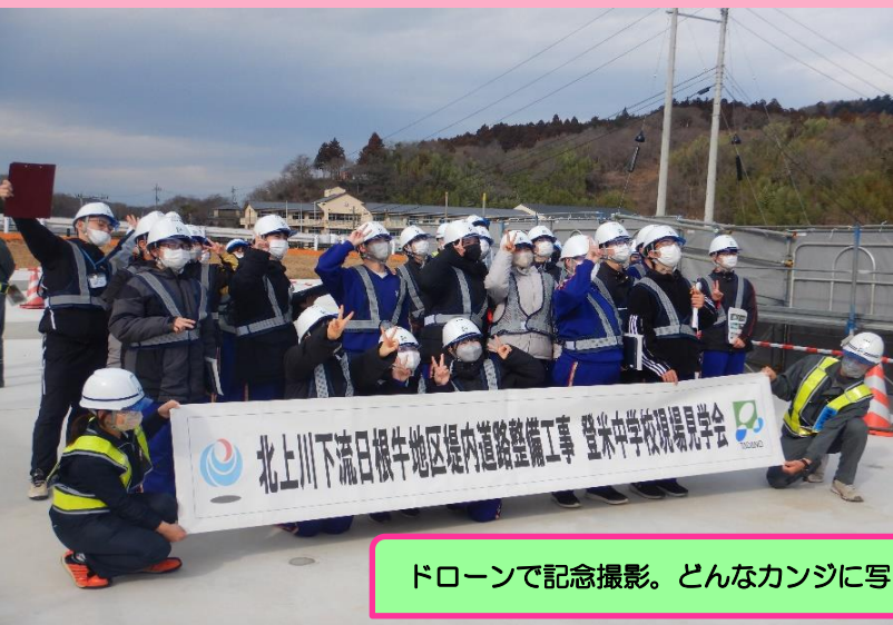
ドローンで記念撮影。どんなカンジに写るかな？