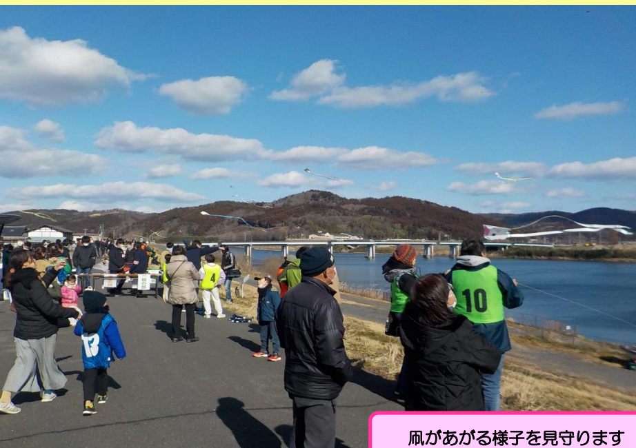
凧があがる様子を見守ります