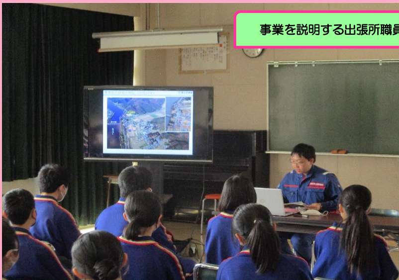
事業を説明する出張所職員