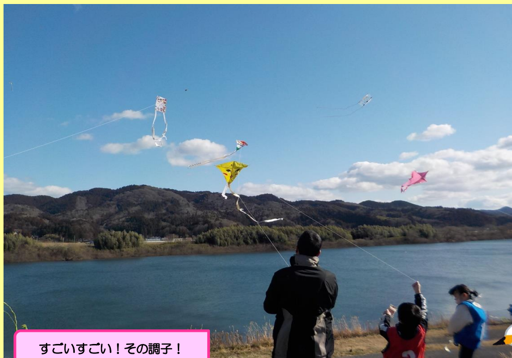
すごいすごい！その調子！

当日は、天候にも恵まれ、絶好の凧あげ日和になりました。親子で作った手作り凧から、愛好家も含めて70名がエントリーし、風と合わせ思い思いのタイミングで北上川の上空へ凧をあげていました。会場には約300人の人たちが集まり、青空にたくさんの凧が空高くあがる様子を見て、大会を楽しみました。