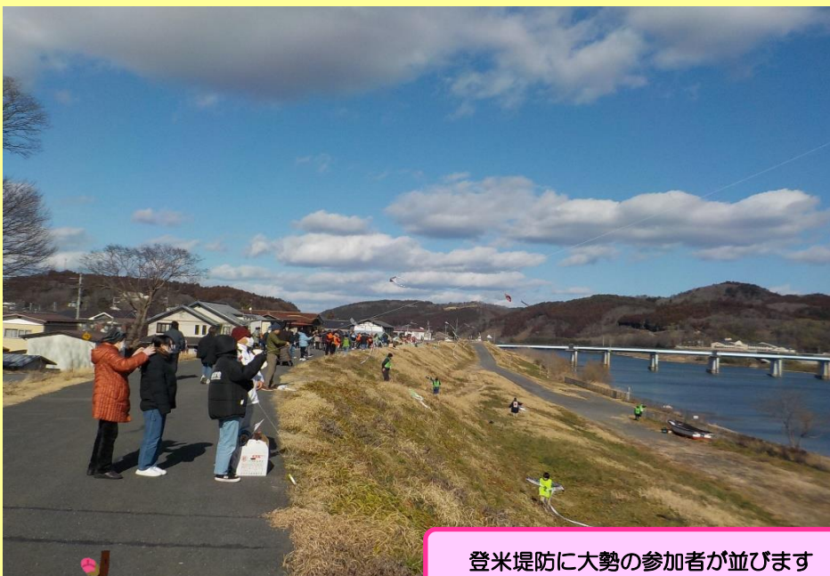
登米堤防に大勢の参加者が並びます