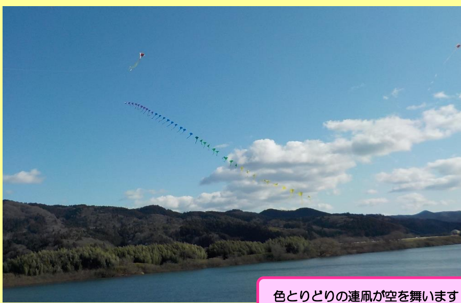
色とりどりの連凧が空を舞います