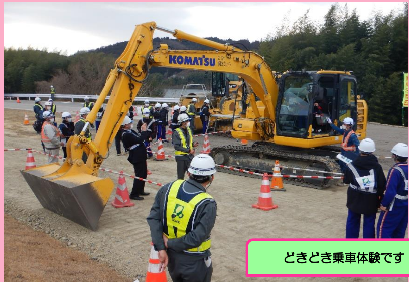
ときどき乗車体験です