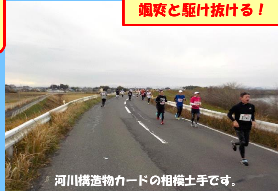
河川構造物カードの相模土手です。