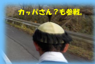
颯爽と駆け抜ける！