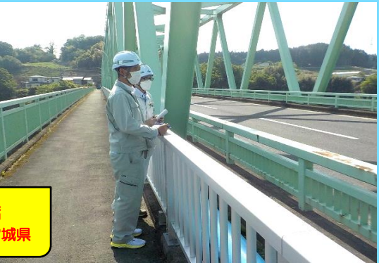
米谷大橋 施設管理者：宮城県