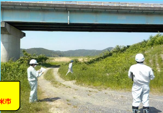
二股橋 施設管理者：登米市

北上川下流河川事務所では、毎年5月～6月に橋梁の施設管理者と合同点検を行い、施設機能の安全性などを確認しています。米谷出張所では、管内6橋梁の点検を順次実施します。現在、一部の点検が終了しており、早急に補修が必要な箇所は確認されておりません。引き続き点検を実施していきます。秋には、樋門・樋管等の点検を実施する予定です。