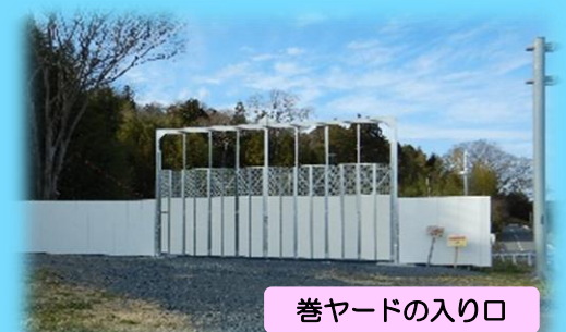
巻ヤードの入り口