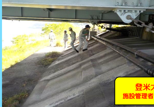
登米大橋 施設管理者：宮城県