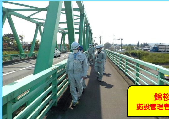
錦桜橋 施設管理者：宮城県