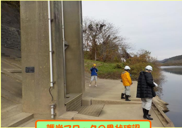
護岸ブロックの異状確認