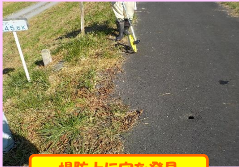
堤防上に穴を発見

米谷出張所では、出水期前（4月～5月）と出水期後（10月～11月）との年2回、管内の堤防を目視で点検しています。出水期後の点検として、10月18日（火）と10月27日（木）に実施し、堤防の異状がないかを確認しました。点検の結果、一部の箇所では異状が発見されたため、補修しました。その他、大きな異状は確認されませんでした。以前の点検から経過観察中の箇所（植生異状、裸地化、堤防法尻の湿潤、モグラ穴等）については引き続き監視をしております。