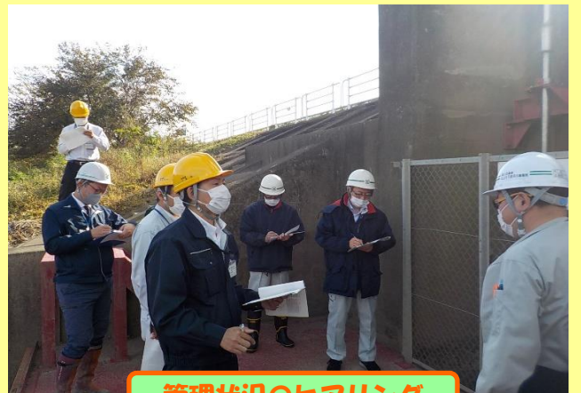
管理状況のヒアリング