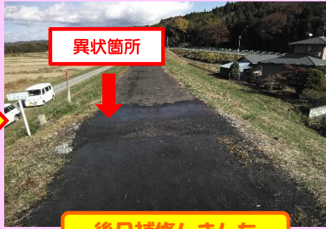
後日補修しました