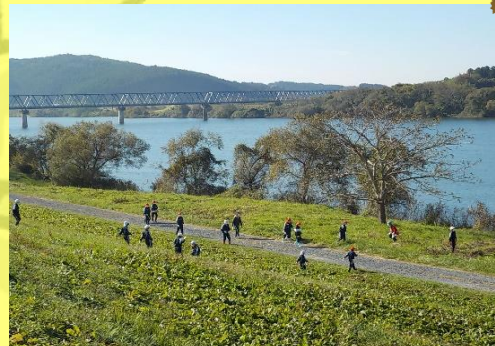
たくさんのごみがあつまりました