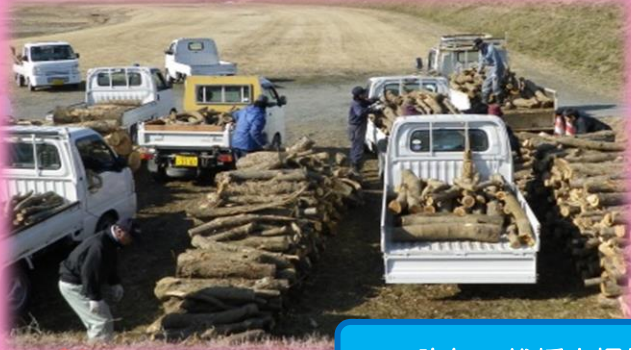
一昨年の伐採木提供の状況

令和4年5月頃から河川の樹木の伐採を開始いたします。 伐採した樹木を提供できる時期（9月頃を予定しています）が来ましたら、北上川下流河川事務所のホームページや米谷出張所だよりにてご案内いたします。