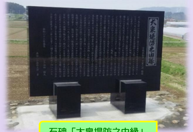
石碑「大泉堤防之由縁」

平成23年3月11日の東日本大震災で倒壊し大きく破損した「大泉堤防之由縁碑」が新たに造られ、平成25年3月10日（日曜日）午前9時00分に現地に再建立されました。再建立は、宮城県と登米市が地元の協力をいただきながら共同で実施しました。