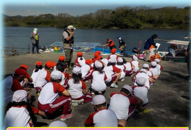
貴重な体験をありがとうございました！