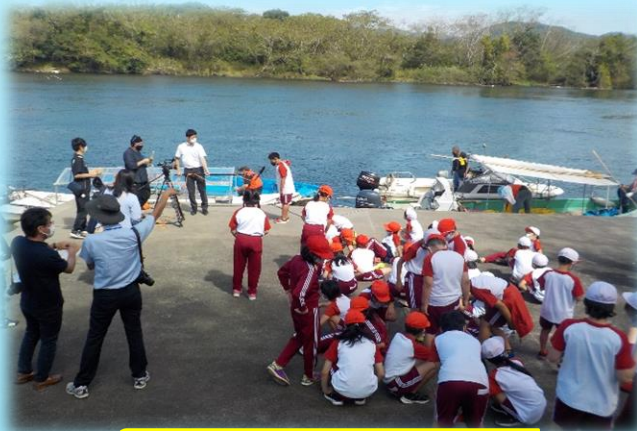
インタビューを受けました