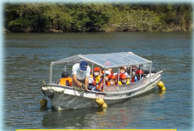
船の上からの景色はどうだったかな？