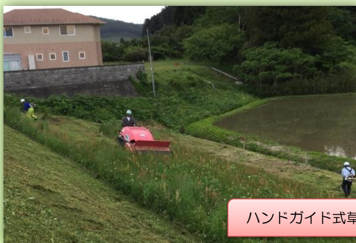
ハンドガイド式草刈機