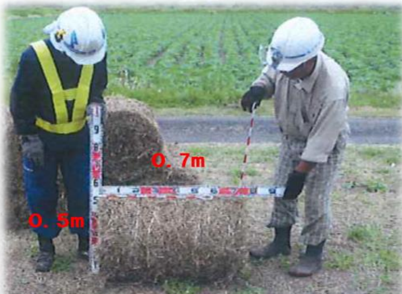
梱包した刈草の大きさ