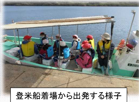
登米船着場から出発する様子