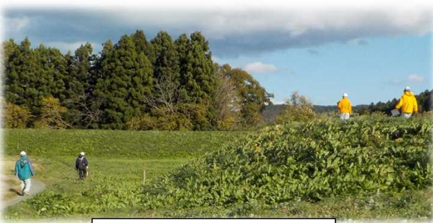
徒歩による堤防点検の様子

点検の結果、緊急的に対策が必要な事象は確認されませんでした。前回の出水期前の点検から経過観察としている植生異状(イタダリの繁茂)、堤防法尻の湿潤、モグラ穴等は引き続き監視をしていきます。