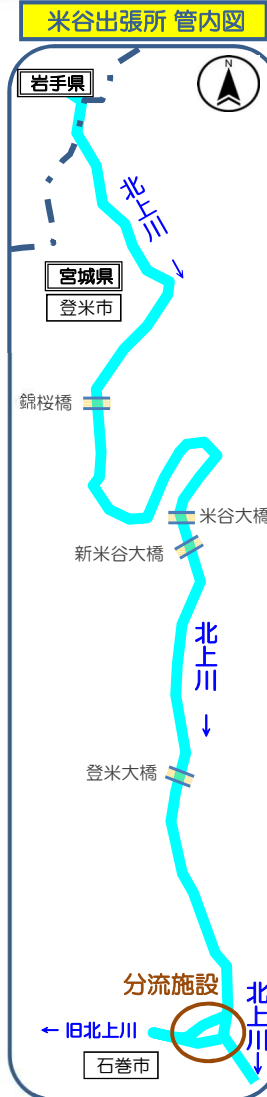
米谷出張所 管内図