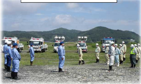
▼排水ポンプ車4台・照明車2台 で訓練が行われました。