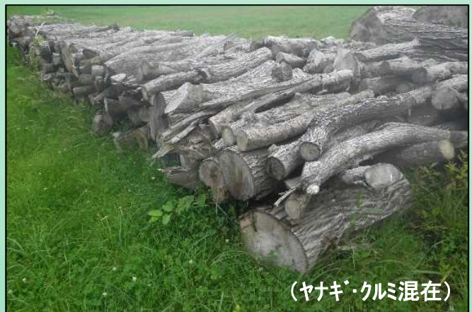
(ヤナギ・クミ混在)

平成 年 月 日 住 所： _____ 氏 名： _____ 印 電話番号： _____ 利用目的： まき ・ 木炭 _____ (どちらかに○)