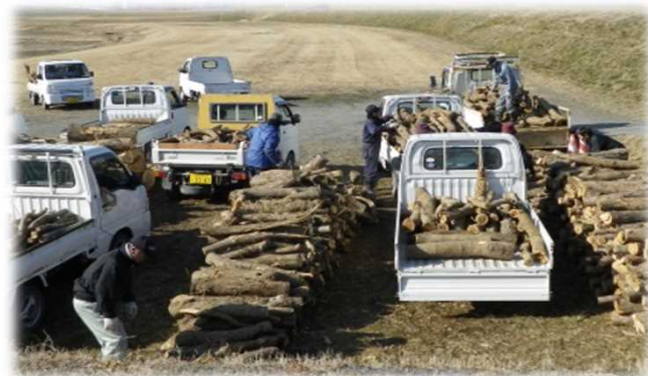
昨年の伐採木の提供状況