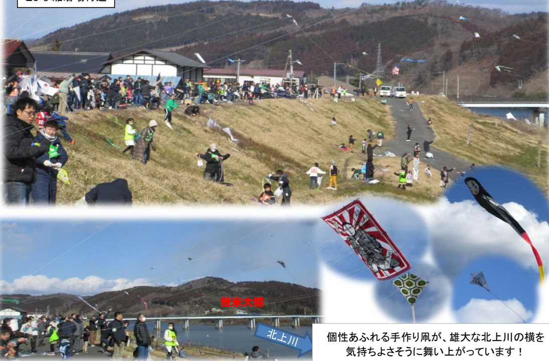
個性あふれる手作り凧が、雄大な北上川の横を気持ちよさそうに舞い上がっています！