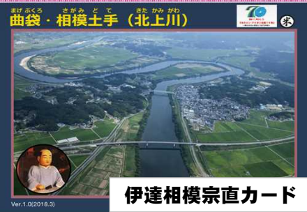
伊達相模宗直カード

カードの配布は 平日 8:30～17:15 米谷出張所2階事務室 ※お一人様各1枚ずつの配布といたします。