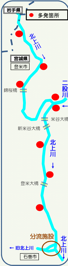
米谷出張所管内 不法投棄多発箇所 重点監視マップ