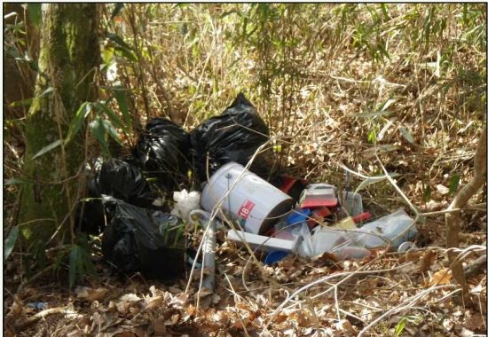
建築材や家庭ゴミ