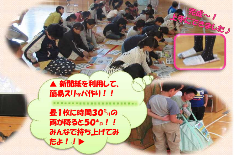
▲ 新聞紙を利用して、簡易スリッパ作り！！ 量1枚に時間30 分 の雨が降ると50 キロ ！！ みんなで持ち上げてみたよ！！