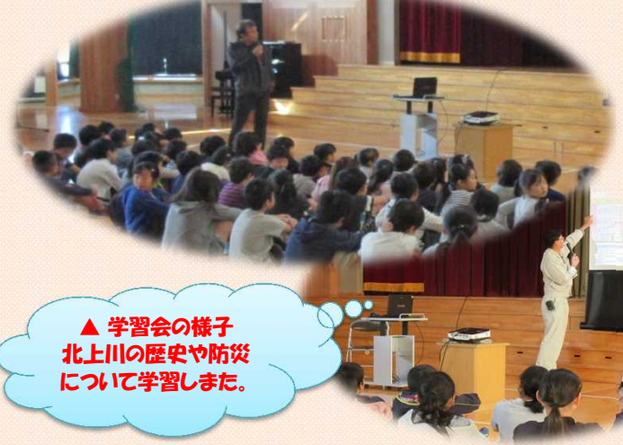
▲ 学習会の様子 北上川の歴史や防災について学習しました。

米谷出張所では、沿川にある登米市立米谷小学校の児童を対象に「とよまかっぱの会」の舟嶋さんを講師に迎え、学習会を開催しました。全校生徒で北上川の歴史や防災についての学習をした後に、5・6年生(34名)を対象に、洪水などの水害についての学習をして防災意識を高め、事前の避難準備の大切さを学んでいただきました。また、体験学習として、いざという時に役立つように、新聞紙を使って簡易スリッパを作ったり、ペットボトルの水50キロを持ち上げる水の重さ体験をして、大雨の凄さを感じることができました。