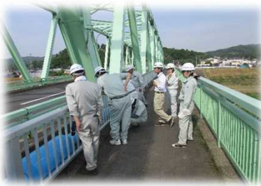
米谷大橋の点検の様子