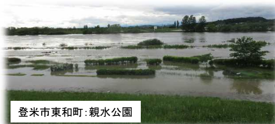
登米市東和町：親水公園