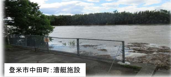
登米市中田町：漕艇施設