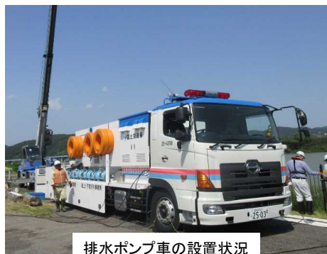
排水ポンプ車の設置状況