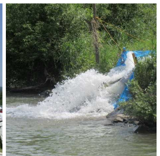
内水排水(ポンプ排水)の状況