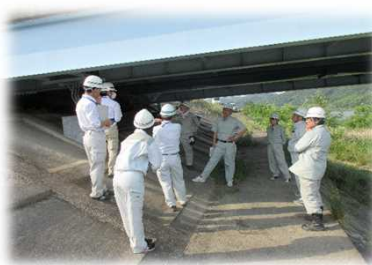
登米大橋の点検の様子