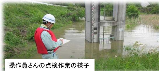
操作員さんの点検作業の様子