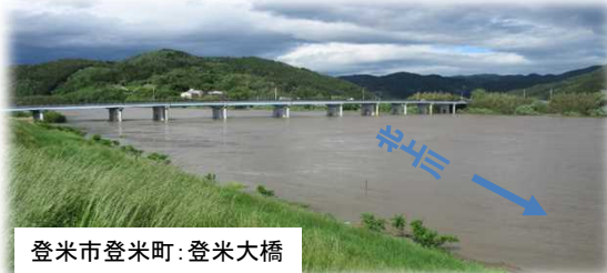
登米市登米町：登米大橋

また、秋田県の雄物川では、5月期として戦後最大となる水位を記録し、昨年の7月・8月に続いて各所で氾濫被害が発生しました。