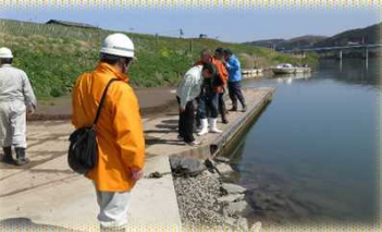
～登米船着場での点検の様子～

米谷出張所では、4月19日(木)に管内5施設の点検を実施し、特段目立った異状は確認されませんでした。