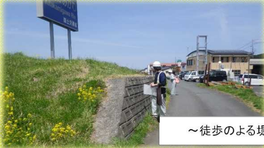
～徒歩による堤防点検の様子～

点検の結果・・・緊急的に対策が必要な事象は確認されませんでした。昨年度から経過観察としている植生異常(イタダリの繁茂)、堤防法尻の湿潤、モグラ穴、ブロック積み擁壁の開き等は引き続き監視をしていきます。