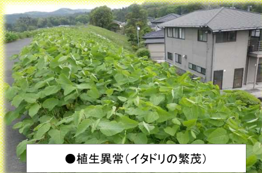
●植生異常(イタダリの繁茂)