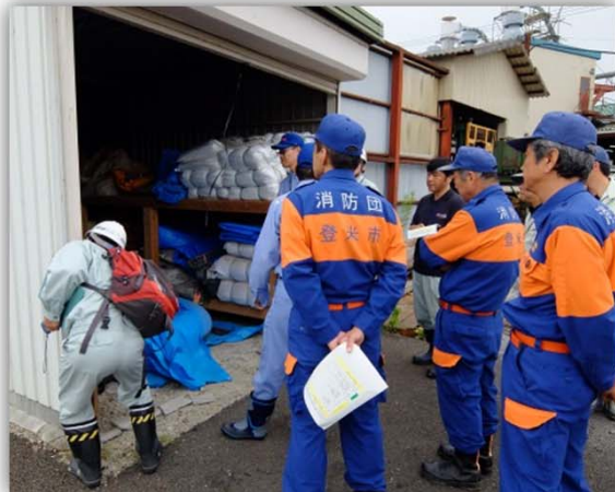
▲各地区の「水防倉庫」で水防資材を確認