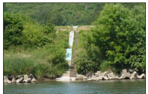
▲河岸の根固めブロックの状況を確認