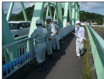
▲錦織橋(宮城県管理)