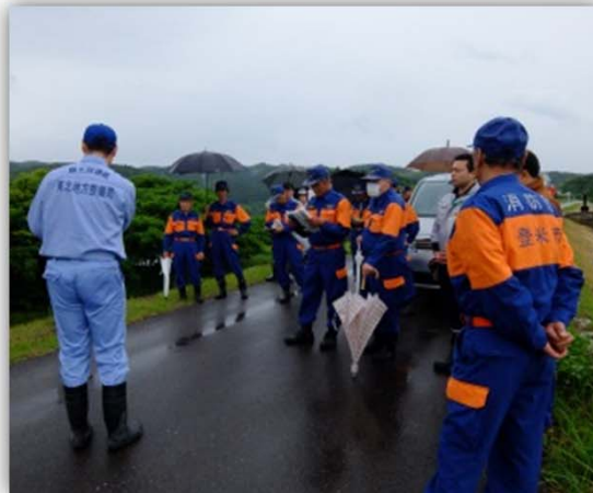
▲70年前のカスリン台風で堤防決壊した北上川右岸48.0k「大泉堤防」等を巡視