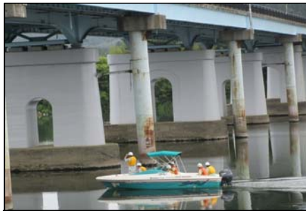
▲普段見られない橋脚周辺を確認