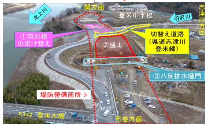
現在(平成29年3月末撮影)