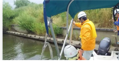
陸上から確認できない護岸や橋脚を船で点検しました。