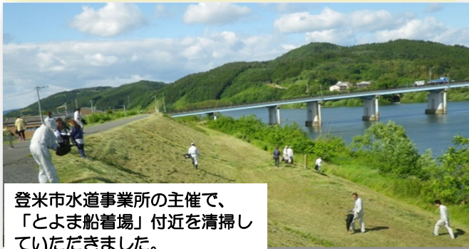
登米市水道事業所の主催で、「とよま船着場」付近を清掃していただきました。