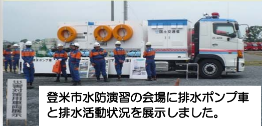
登米市水防演習の会場に排水ポンプ車と排水活動状況を展示しました。