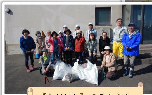
『かけはし』のみなさん、 ありがとうございました!