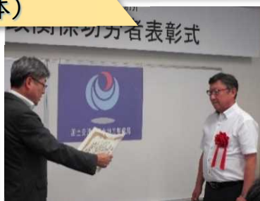
吉田川粕川地区外掘削護岸工事 (株)丸本組 様