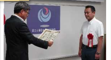
鳴瀬川練牛上流地区築堤工事 (株)今野工務店 様