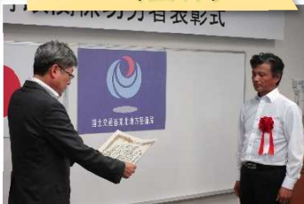
吉田川粕川地区外掘削護岸工事 (株)岩手マイタック 様