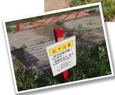
↑危険箇所には看板を設置しています。近づかないでください。(白鳥公園内)

4月18日(木)、堤防に隣接する広場や親水公園などの水辺の安全利用点検を実施しました。 この点検はゴールデンウィークや夏休み前など、河川でのレジャーが増える時期に北上川下流河川事務所が一斉に行っているものです。鹿島台出張所管内では木間塚大橋付近の白鳥公園、感恩橋付近の親水公園、鳴瀬川中流堰の船着き場の点検を行いました。一部を除きいずれも安全に利用できる状態でしたが、利用される際はマナーを守り、気象状況などにも十分注意しながら安全に気を付けて楽しんで下さい！