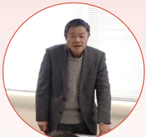
▲下二郷3行政区の大橋区長