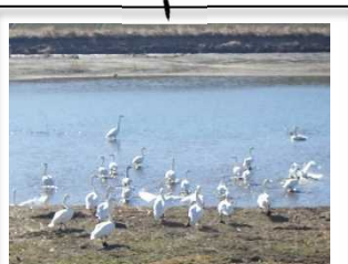
ゴミもなく白鳥たちも のびのび

河川区域に大きな変状や不法投棄もなく順調です。一般巡視では徒歩によるパトロールも行っており、堤防を歩いている方などからの情報提供も見逃さないよう日々心がけています。