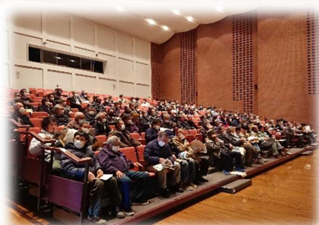
▲水門等水位観測員のみなさん

講習会では洪水時の対応や日頃のゲート操作の注意点、点検のポイント等を再確認して頂きました。