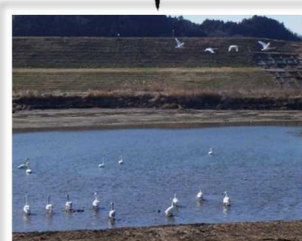
飛び立つ瞬間を激写!