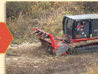
樹木を押し倒して破碎、木くずと土砂を攪拌