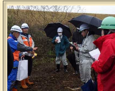
見学者からは質問も