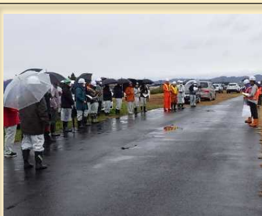
小雨の中たくさんの 見学者が集まりました

11月29日（水）、鹿島台管内下流維持工事を請け負う(株)佐藤工務店が自走式伐採混合機を使用した樹木伐採の試験施工を行いました。 自走式伐採混合機とは、樹木を押し倒しながら破碎（チップ化）し、破碎した木くずと土砂を攪拌する機械です。 この機械の導入により、年々上昇している労務費や燃料・資機材費のコスト縮減、施工管理や現場作業の簡素化・効率化等が期待されています。 国内にはまだ2台しかなく、実稼働しているのはこの1台のみです。 試験施工には官公庁のほか民間企業や河川愛護団体など各方面から30名程が参加し、実際に樹木を伐採・攪拌の様子を見学した後、質問や意見を交わしました。