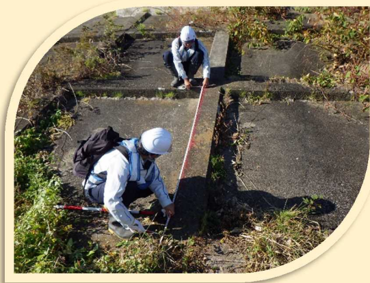
▲目地の開きを測定しています