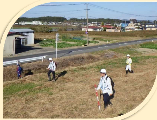
▲徒歩巡視の様子（川裏の法面の状況確認）