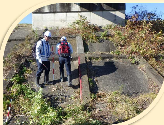
▲高水護岸の目地の開き等を確認