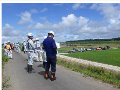
安全パトロールの様子

8月8日(火)、工事現場や現場事務所の安全点検を実施しました。この点検は、現場での工事事故を防ぐために定期的に行っているものです。今回は、吉田川粕川地区河道掘削工事の若生工業、丸本組、武山興業の3社の点検を行いました。3社とも適切な安全管理で掘削・運搬作業が行われていました。特に今年の猛暑の中で作業を行う現場作業員が熱中症にならないよう、冷却機能ファン付きの安全ベストを着用したり、日陰の休憩所を設け水分補給や冷却剤がいつでも使用できるように準備されていました。