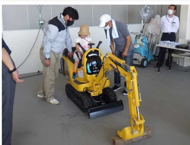
電動バックホウに乗ってみた♪