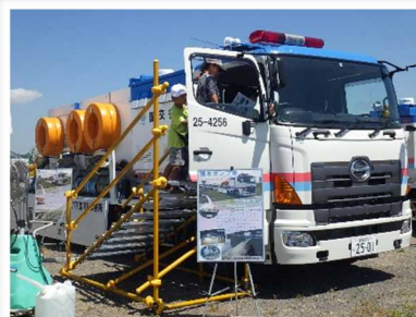
排水ポンプ車カッコイイ～！