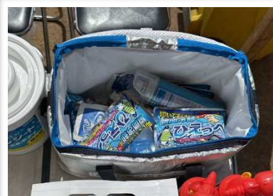
クーラーBOXに冷却剤もたくさん!