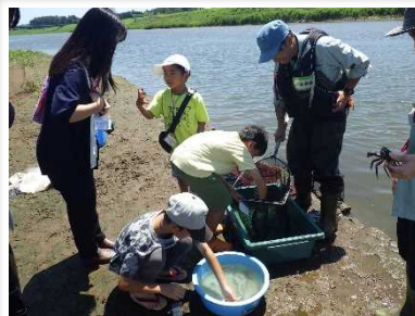
定置網を引き上げたらいろんな生物