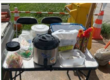
冷たい麦茶や塩分補給のアメ。ハチ対策スプレーも。