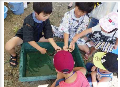
ウナギつかまえた～！！