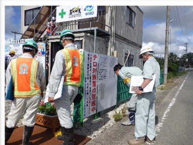
現場事務所点検の様子