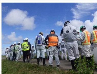
冷却ファン付きの安全ベストを着用中