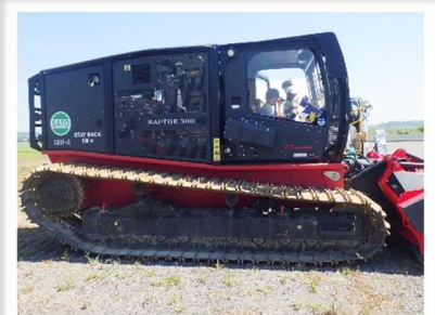
自走式伐採混合機に乗車！！