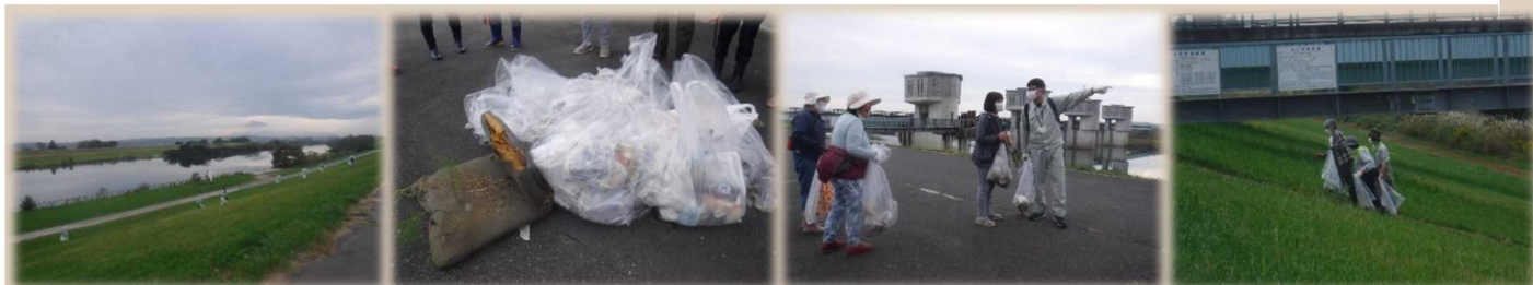
▲45Lゴミ袋8個分のゴミを収集しました

反面、道路側には缶やペットボトルがまとめて捨てられていて、手分けして回収しました。