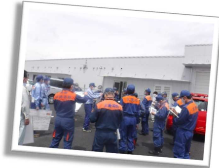
5月に完成した志田谷地防災センター （吉田川の水防災拠点）

台風等の大雨により、出水が起こりやすくなる これからの時期に備えて、出水時に危険になる ことが予想される箇所（重要水防箇所※）や 工事箇所などを、市町村・水防団のみなさんと 河川管理者が合同で巡視しました。 また、水防資材の確認もおこない、必要な物資 が足りているかどうかなど協議しました。