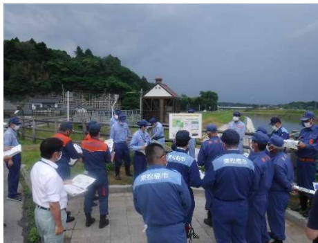
↑ 現地での説明（東松島市）