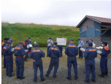
↑ 水防倉庫の確認（大崎市松山地区）