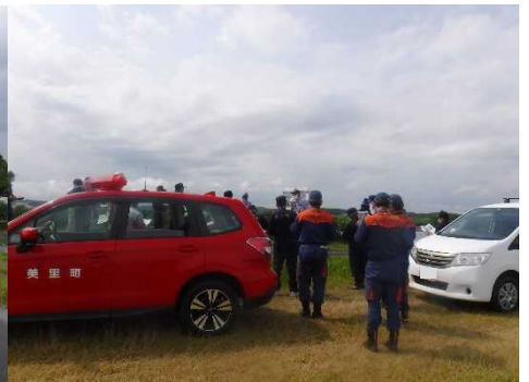
巡視終了後は、現地で水防団から ご意見をいただきました（美里町）