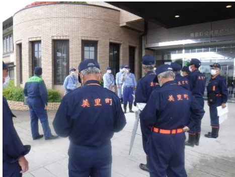
↑ 出発前に巡視行程を説明 （美里町南郷庁舎前）