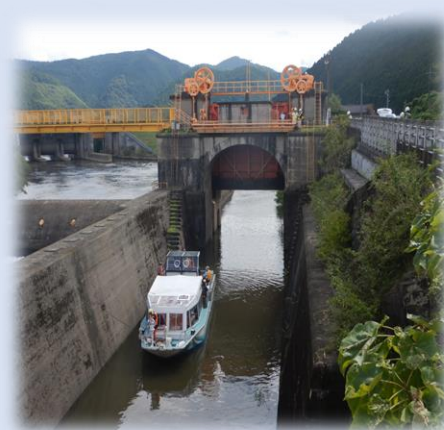
船での通船の様子