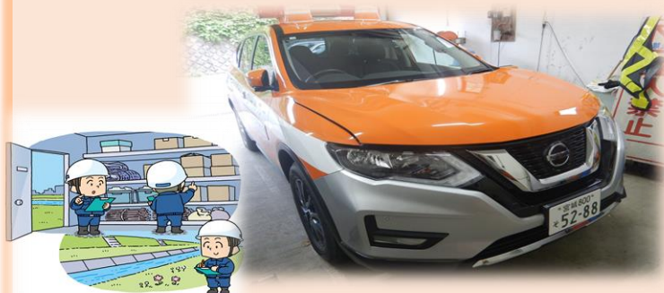
河川巡視パトロールカー

飯野川出張所では、北上川（柳津大橋付近から河口までの約26km）と旧北上川（分流施設から神取橋付近までの約12km）を主に管理しています。管理区間を週に2周巡回して、施設は安全に利用できるか、不法投棄などの不法行為がされていないかなど、みなさんが河川を安全かつ快適に利用できるよう日々パトロールしています。写真のようなオレンジ色の車を見かけたら、河川のパトロールをしている車です。ご協力をお願いいたします。