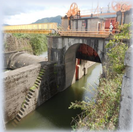
脇谷閘門（北上川側の門扉）

北上川から旧北上川の合流点にある脇谷閘門を通船する方は事前に飯野川出張所へご連絡ください。ゲート操作のための準備が必要となりますので、通船する日の 1週間前 までにご連絡ください。