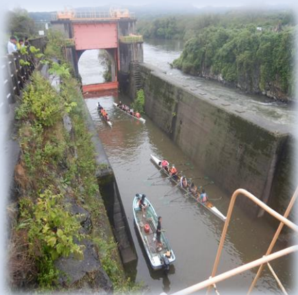
ボートでの通船の様子