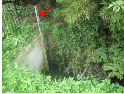
◀石生排水樋管 設置前↑