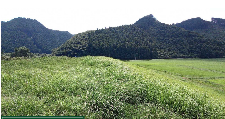
◀ 櫻崎堤防 除草前

8月26日から実施していました飯野川出張所管内堤防除草が、11月2日に終了しました。今年度、維持工事を受注した(株)瀬崎組と協力会社による作業により、約1,371千m 2 除草を実施しました。今年度は、5月に実施した1回目と合わせ、約2,742千m 2 の除草を実施しました。来年度も堤防の維持管理のため、継続して実施する予定です。