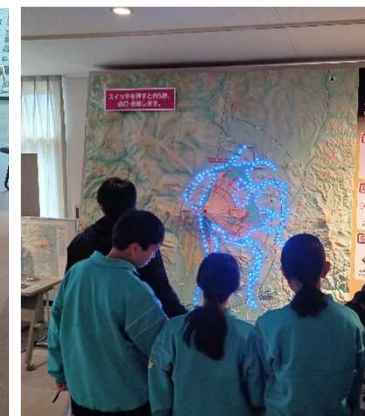
岩手山の被災予想ジオラマで被害範囲を確認