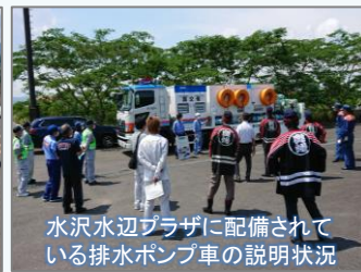
水沢水辺プラザに備わっている排水ポンプ車の説明状況

「重要水防箇所」とは、洪水時に危険が予想され、重点的に巡視点検が必要な箇所をいいます。