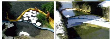
油回収作業の様子

河川に油類が流出した場合、飲料水・工業用水・かんがい用水等の取水停止や生態系への悪影響など、重大な被害が発生する恐れがありますので、油類の取り扱いには十分にご注意ください。