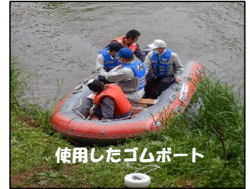
使用したゴムボート

水沢出張所では、5月28日、29日の2日間、ゴムボート2艇を使用して河川巡視を行いました。普段、地上から確認することが難しい河岸や橋脚周辺を船上から見ることにより、隠れた危険箇所がないか確認するために行っており、今回の巡視では特に重大な異常等は見られませんでした。船上巡視は地域の安全を守るため、定期的に行っております。