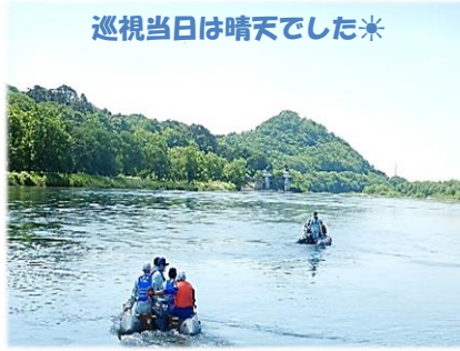
巡視当日は晴天でした*