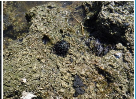
オオバタクルミの化石