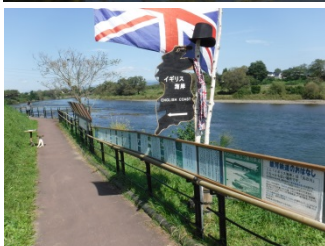
パネル等の展示状況