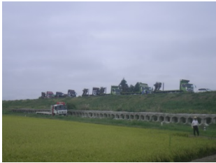
奥州市二渡地区の積込状況