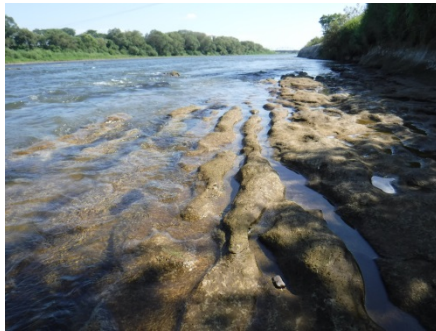
「畑の波」のような景色