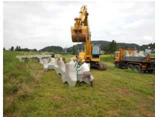
北上市稲瀬地区の積込状況