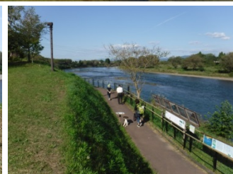
一般客の来訪状況