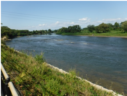
イギリス海岸出現状況