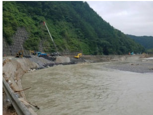
宮古市曇目地区 国道106号復旧状況