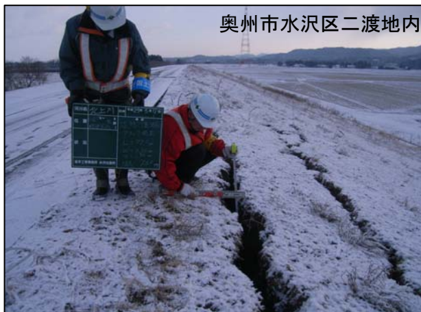
奥州市水沢区二渡地内

現在も余震が多く続き被害箇所周辺は大変危険ですので近づかないようお願いいたします。ご不便お掛けしますが、ご理解とご協力をお願いいたします。