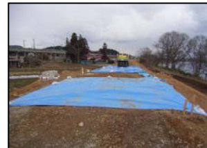
シート防護の状況