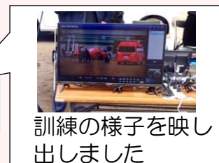
訓練の様子を映し出しました