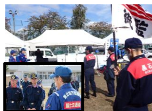
▲黒石市長へ支援体制説明状況

当事務所では、リエゾン※派遣による想定報告を実施したほか、災害対策機器のパネル展示を行いました。また、災害現場からの映像配信等の通信回線確保として、通信機器 i-RAS(アイラス)の実運用試験を実施しました。