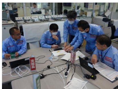
▲被災箇所の確認・報告

令和7年10月3日(金)、浅瀬石川ダムと津軽ダムで「東北地方整備局総合防災訓練」を行いました。