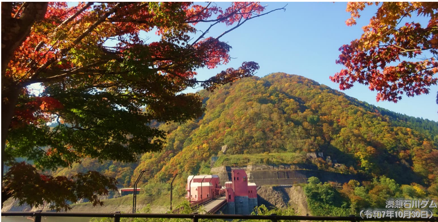
浅瀬石川ダム (令和7年10月30日)