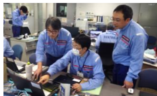
▲システム入力の確認