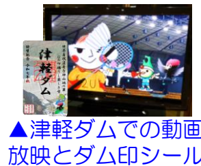
▲津軽ダムでの動画放映とダム印シール

ダムのライトアップは、地域の魅力を発信し観光や交流の促進に貢献する取り組みとして、今後も継続して実施してまいります。