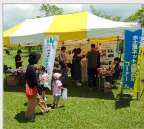
浅瀬石川コーナー

浅瀬石川土地改良区による、浅瀬石川を紹介するパネル展示には、たくさんの方が訪れ、興味深そうにパネルを見ていました。