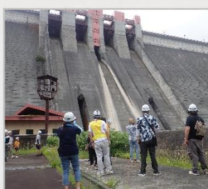
ダム堤体・発電所 見学ツアー

普段はなかなか見ることができないダムや発電所の内部を見学できるツアーを実施しました。毎回定員に達するほどの人気を集め、大変好評でした。