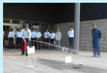
▲消火器訓練の様子