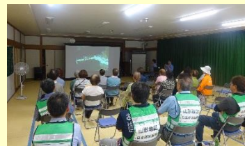
▲過去の被害についての動画