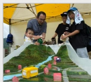
ダム効果模型実験

普段はなかなか見ることができないダムや発電所の内部を見学できるツアーを実施しました。毎回定員に達するほどの人気を集め、大変好評でした。