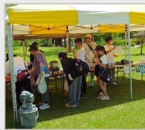
水の飲み比べと パネル展

「水の飲み比べ」では、津軽広域水道企業団で浄水した水と他2種類の水を飲み比べて、当てるといふクイズ形式の催しでした。まるやかでおいしい水を体感できる催しとして、多くの方にご参加いただきました。