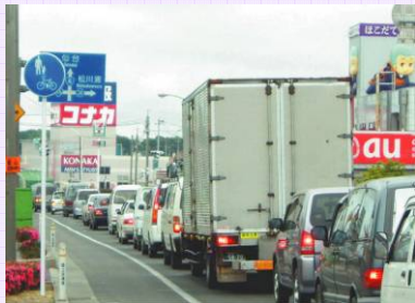
▲BP開通前の相馬市内の混雑状況 (塚ノ町二丁目地内)