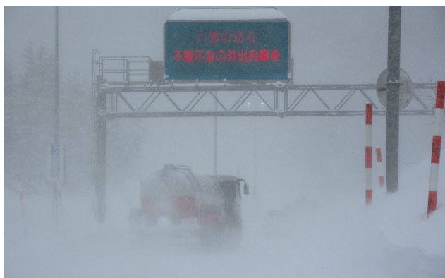
令和4年2月 国道13号 福島市 ホワイトアウト発生状況