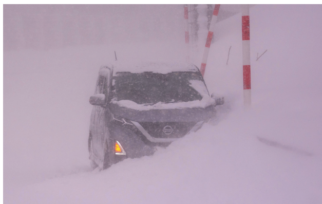
令和4年2月 国道13号 福島市 雪壁への衝突事故