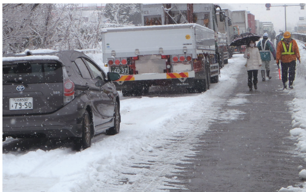
平成26年2月 国道4号 福島市 スタック発生による車両滞留