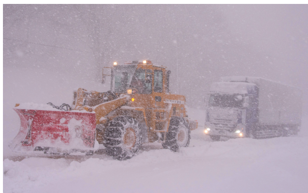
令和4年2月 国道13号 福島市 スタック車両のけん引