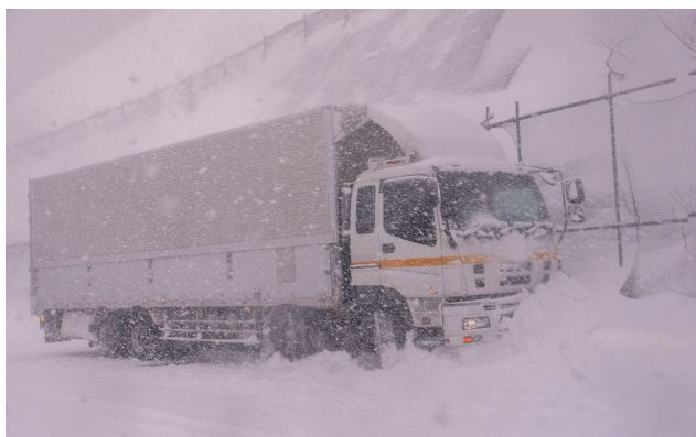
令和4年2月 国道13号 福島市 雪壁への衝突事故