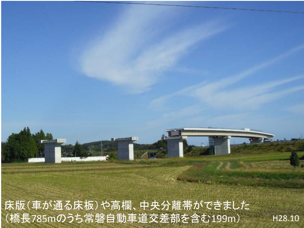
床版(車が通る床板)や高欄、中央分離帯ができました (橋長785mのうち常磐自動車道交差部を含む199m) H28.10