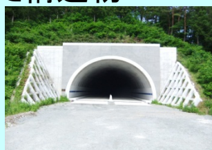
まつがぼう 松ヶ房トンネル