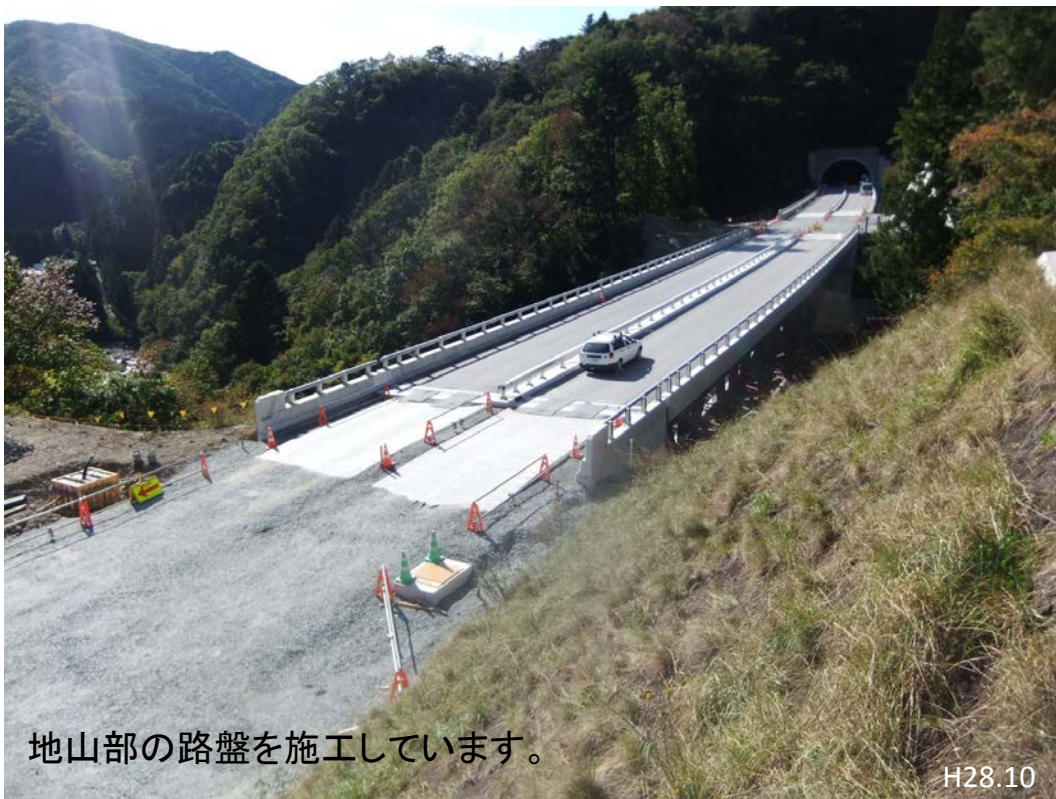
地山部の路盤を施工しています。 H28.10